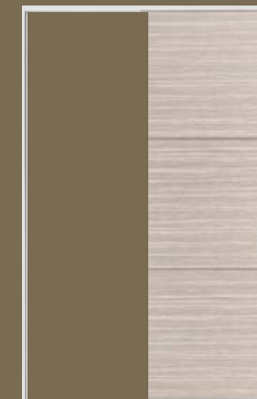
洋室引戸 NO.10 ボーダー